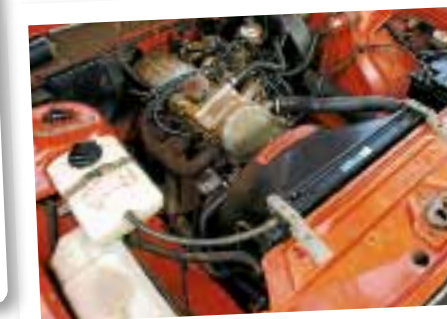
Det är rent och snyggt runt B21-motorn på 100 hk.