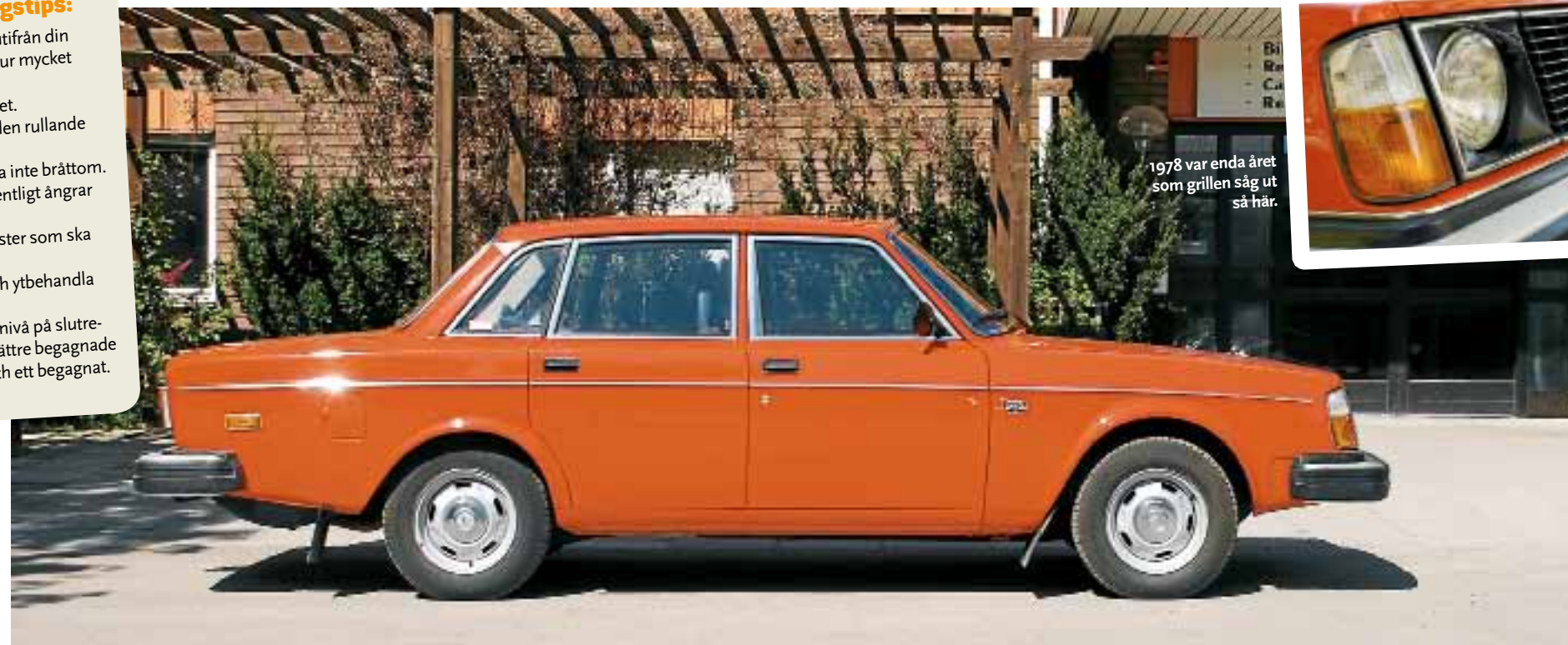
1978 var enda året som grillen såg ut så här.