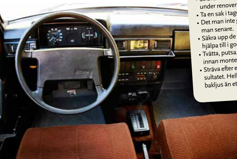
Välkommen in i Volvos 1970-tal. Totalt fjäskfritt och en färgskala som kräver självförtroende.