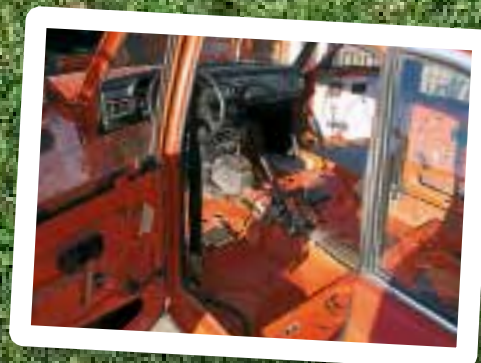
Arbete pågår! Inredningen lyftes ut för att kunna rengöras ordentligt.